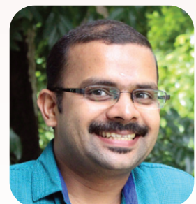
സനു തെറ്റയിൽ, മേയ്ക്കാട്

വസിക്കുന്നവന് മലയും മലമ്പ്രദേശത്തു നിന്ന് വരുന്നവന് കടലും എന്നും കൗതുകമുണർത്തുന്ന ഒന്നാണല്ലോ. തികച്ചും മാനുഷികം. ഇക്കര നിൽക്കുമ്പോൾ അക്കരപ്പച്ച എന്ന് പറഞ്ഞു നിസ്സാരവൽക്കരിയ്ക്കരുത് അതിനെ. അന്നന്നുള്ള കഷ്ടതകൾ ഒരുവൻ സഹിക്കുന്നത് ഒരുദിവസം ഇതൊക്കെ അവസാനിക്കും, ‘എനിയ്ക്കും ഒരു കാലം വരും’ എന്ന